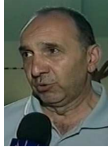
el entrenador المدرب

ما بيتمرنوا بس كرة السلة بيتمرنوا ألعاب... ممكن ألعاب بدنية تناسب أجسامهم أو تعود أجسامهم على كل أنواع الحراكية... تساعده بالمستقبل ممكن ما يكون لاعب كرة السلة تماما أو يكون... يبرز بنوع ثاني من الرياضة لكن من الضروري أنه بهذا السن المبكر أنه الطفل يلعب ويحرك جسمه بكل الإمكانيات التي ممكن يؤديها